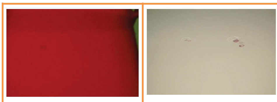
Sample detail after testing