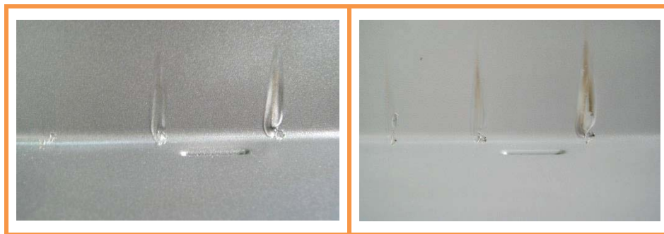
Sample detail after testing