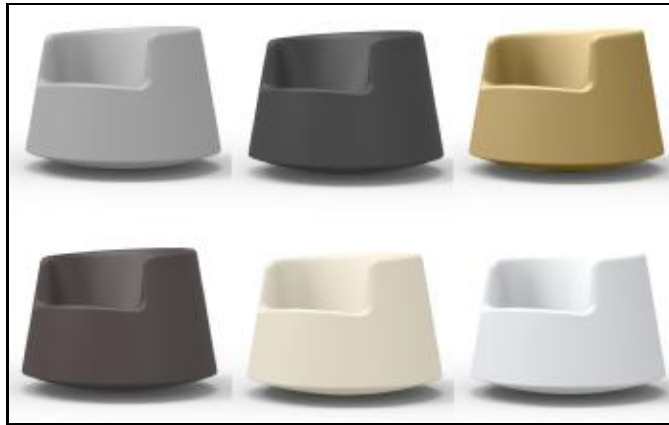
61002 ROULETTE (Steel, Anthracite, Beige, Bronze, Ecu, Ice)