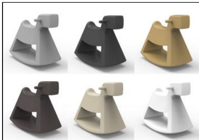
61003 ROSINANTE (Steel, Anthracite, Beige, Bronze, Ecu, Ice)