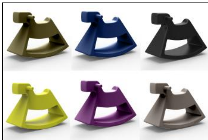
61004 ROSINANTE LITTLE (Khaki, Navy, Black, Pistacho, Plum, Taupé)