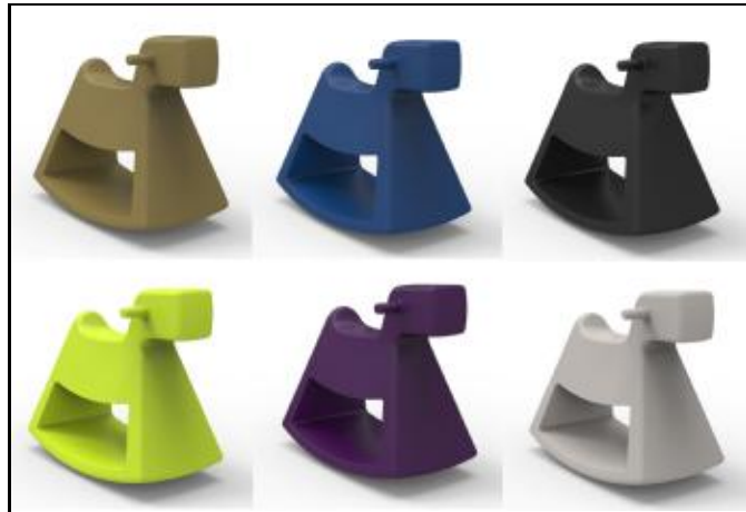
61003 ROSINANTE (Khaki, Navy, Black, Pistacho, Plum, Taupé)