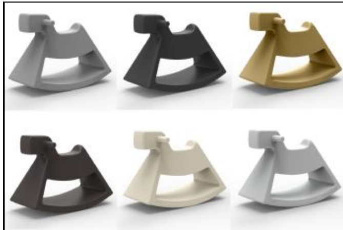
61004 ROSINANTE LITTLE (Steel, Anthracite, Beige, Bronze, Ecrú, Ice)