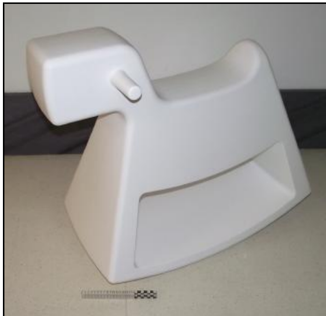
61003 ROSINANTE (en caja/in box) (White)