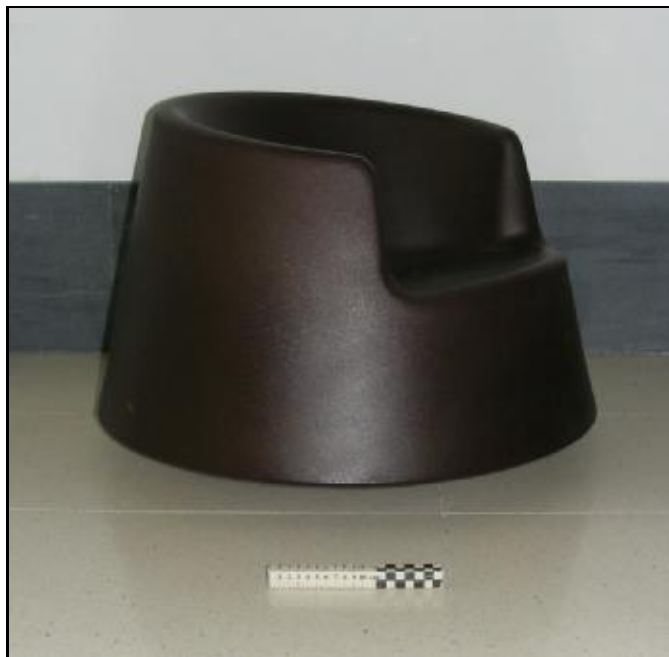
61005 ROULETTE LITTLE (en caja-in box) (Bronze)