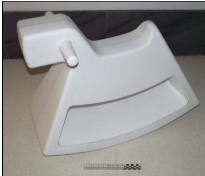
61004 ROSINANTE LITTLE (en caja/in box) (White)