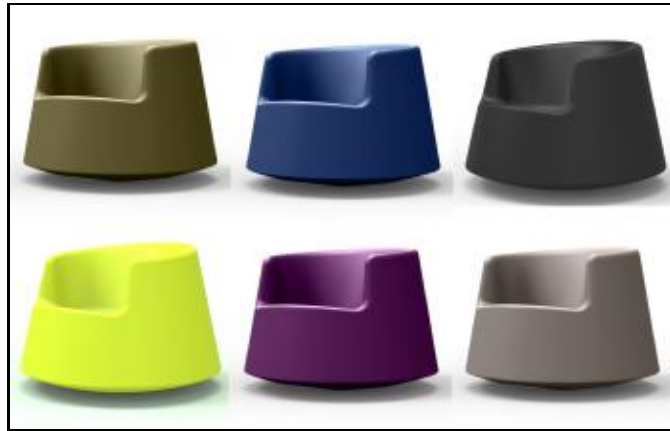
61005 ROULETTE LITTLE (Khaki, Navy, Black, Pistacho, Plum, Taupé)