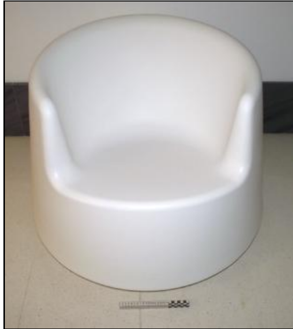
61002 ROULETTE (en caja/in box) (White)