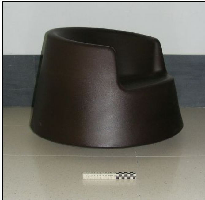
61005 ROULETTE LITTLE (Plum, Navy, Khaki, Taupé, Ecrú, Beige, Ice, Pistacho, Anthracite, Steel, Bronze, Black, White).