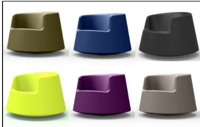
61005 ROULETTE LITTLE (Plum, Navy, Khaki, Taupé, Ecrú, Beige, Ice, Pistacho, Anthracite, Steel, Bronze, Black, White).