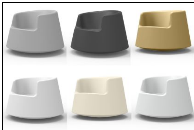
61005 ROULETTE LITTLE (Plum, Navy, Khaki, Taupé, Ecrú, Beige, Ice, Pistacho, Anthracite, Steel, Bronze, Black, White).