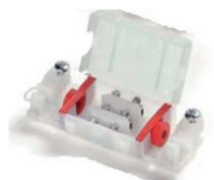
The block will be similar to the following figure:

The location of the block must be inside the roof or in an enclosed space away from people.