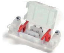
El bloque será similar a la siguiente figura

La ubicación de dicho del bloque deberá quedar en el interior del techo o en un espacio cerrado fuera del alcance de las personas.