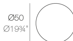
VERTEX Mesa Ø50 VERTEX Table Ø19 3/4"